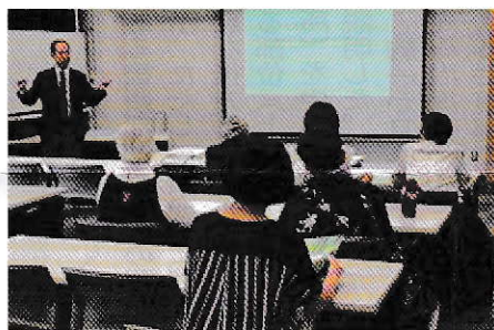
東北支部講演会風景

ている方は、(株)東京光線メディカル(03-5759-6333)までお問い合わせください。